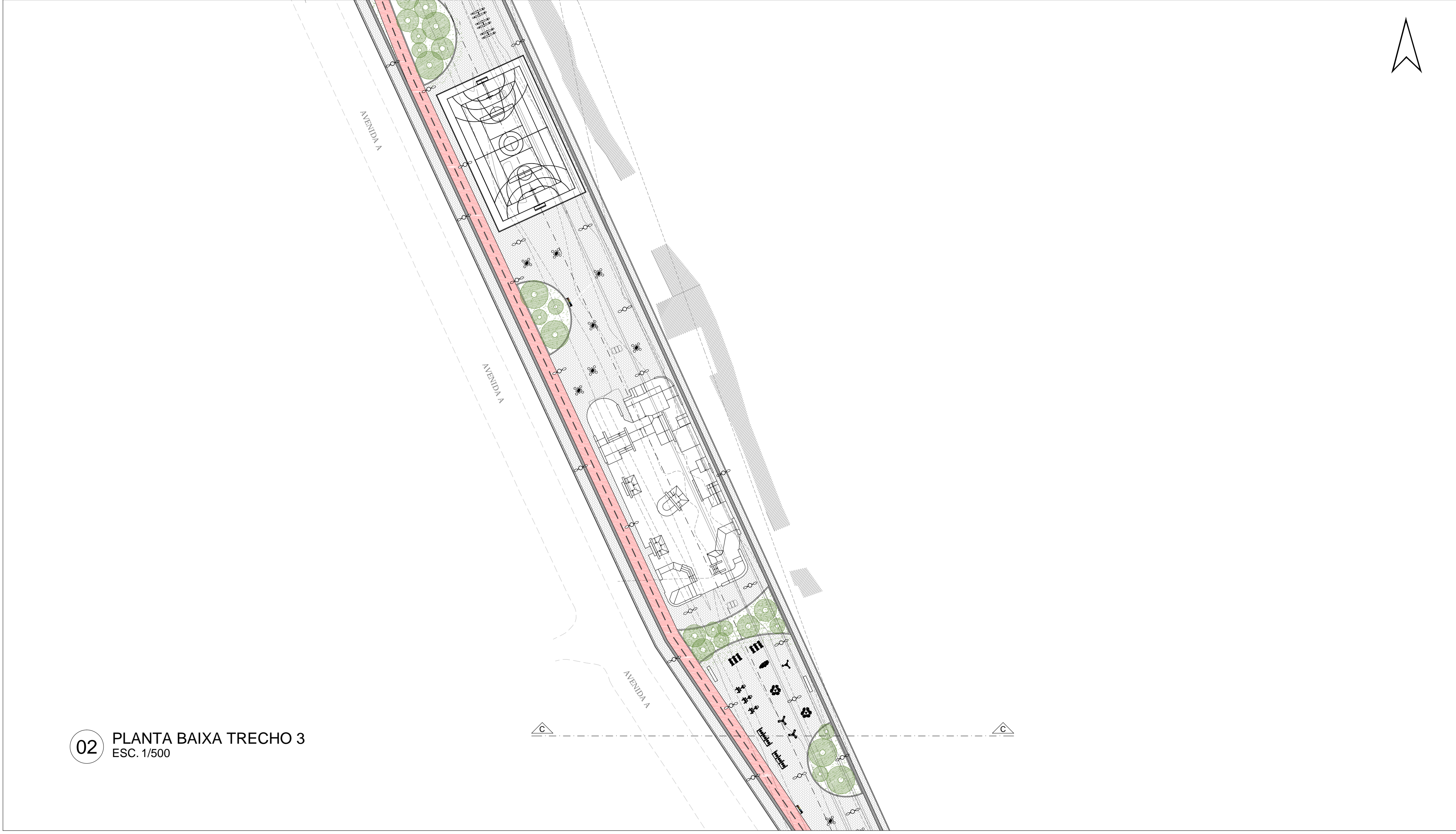
02 PLANTA BAIXA TRECHO 3 ESC. 1/500