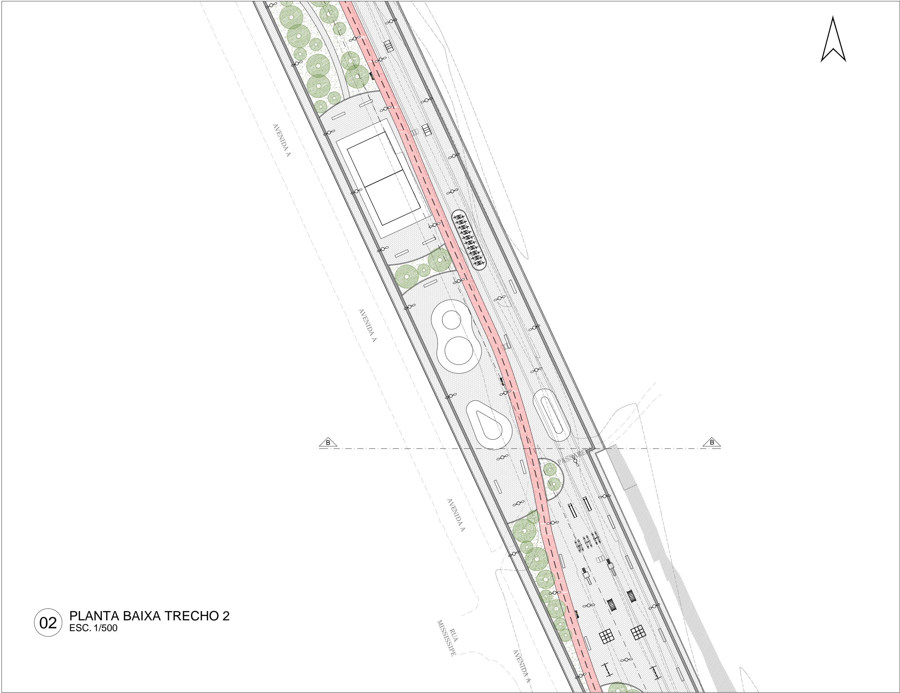
02 PLANTA BAIXA TRECHO 2 ESC. 1/500