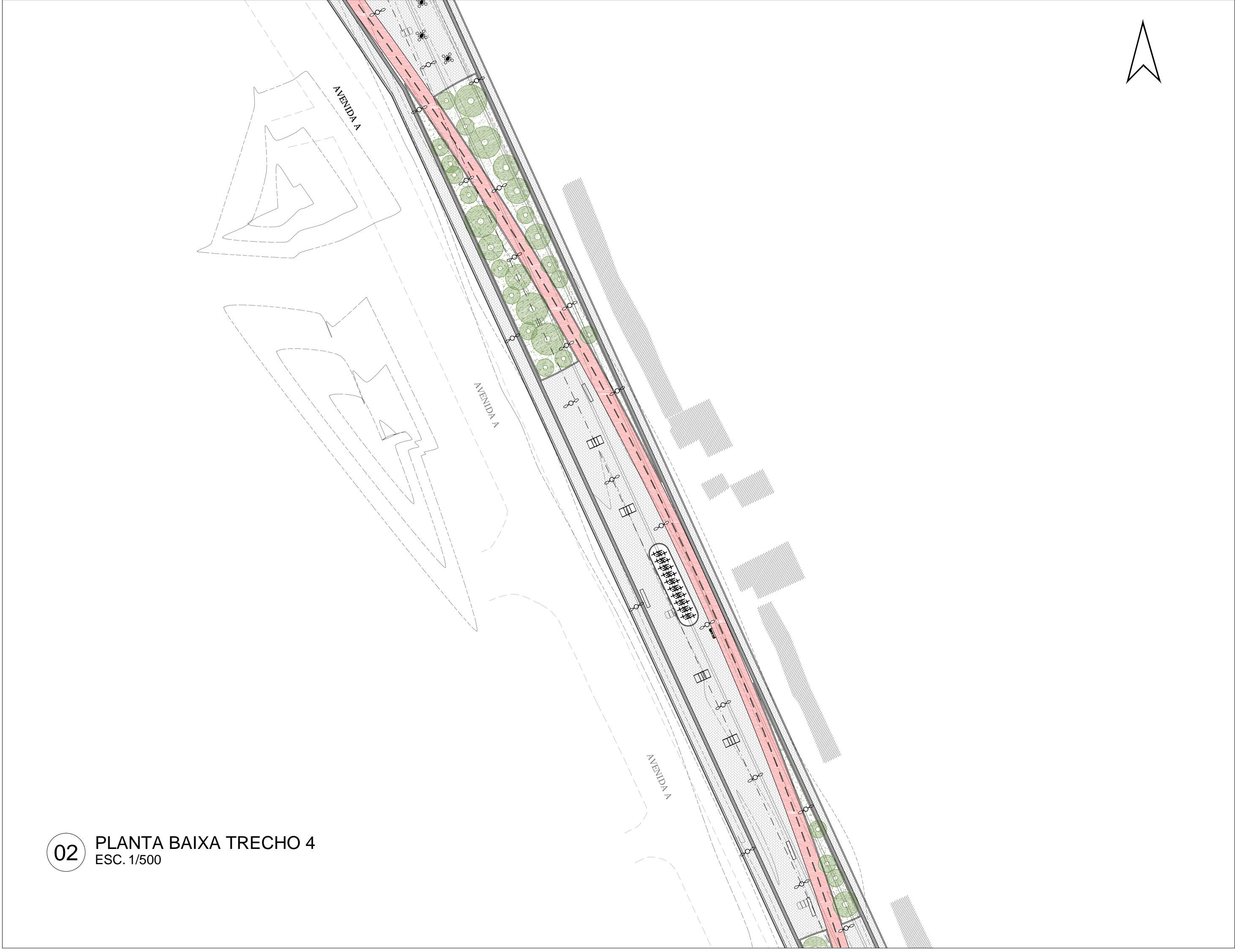
02 PLANTA BAIXA TRECHO 4 ESC. 1/500